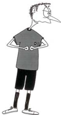
909 Nedozvoljena grubost (nadlanice usmerene naviše)