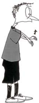
903 Podizanje palice protivnika (šake usmerene naviše)