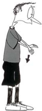
902 Blokiranje palice protivnika (šake usmerene naniže)