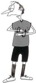
922 Nepravilna izmena (podlaktice rotiraju)