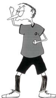
904 Visoko podignuta palica (imitacija držanja palice)