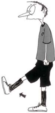
913 Visoko šutiranje (stopalo se pomera napred, do nivoa kolena)