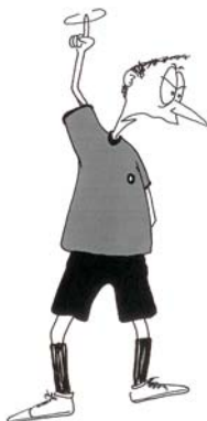
924 Odugovlačenje igre