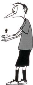
916 Nepravilan skok (šake usmerene naviše)