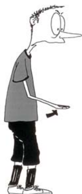
920 Igranje rukom (šaka usmerena naviše)