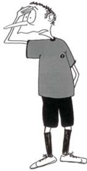
921 Igranje glavom (šaka na čelu)