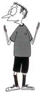
915 Nepravilno rastojanje (podlaktice se drže uspravno)