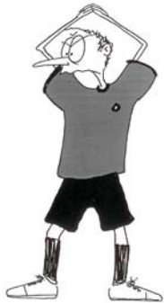
914 Ulazak u golmanski prostor