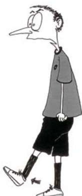
912 Nepravilno šutiranje (stopalo se pomera napred, do nivoa zglobov)