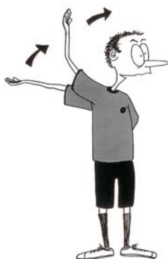
918 Nepravilno izveden aut / nepravilno izveden slobodan udarac (šaka se kreće prema napred, u smeru izvedenog slobodnog udarca, a zatim se pomera kao što je pokazano)