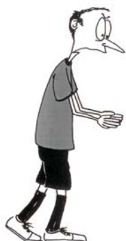
917 Nepravilno izbacivanje loptice (podlaktice se drže vodoravno, šake usmerene jedna ka drugoj)