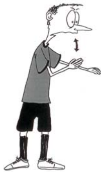
923 Ponovljeni prekršaji (tri udarca rukom)