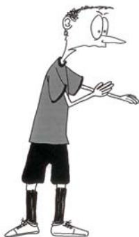
901 Nepravilan udarac (jedan udarac rukom)